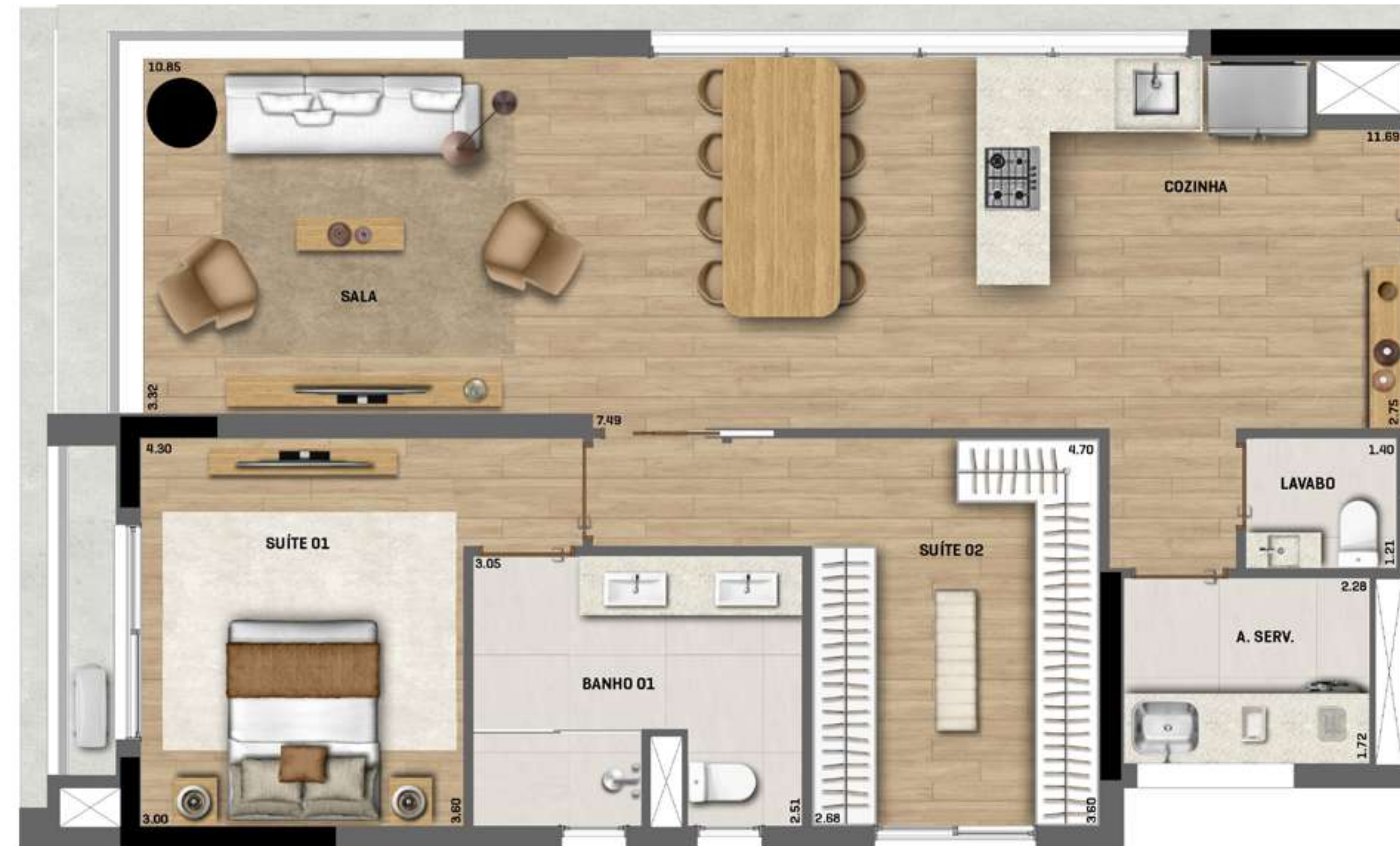
Apartamento Final 01 - Opção 1 Suíte ÁREA TOTAL = 93m 2