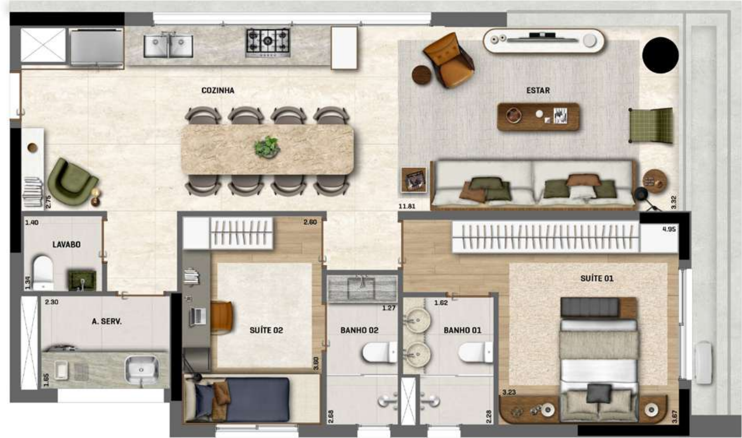
Apartamento Tipo Decorado Final 02 ÁREA TOTAL = 93m 2