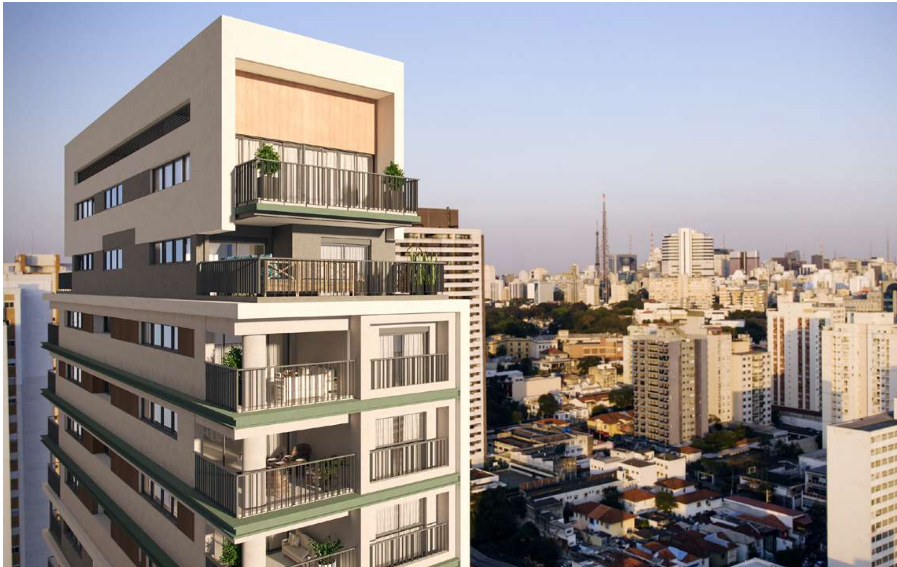
Perspectiva ilustrada do detalhe da Fachada