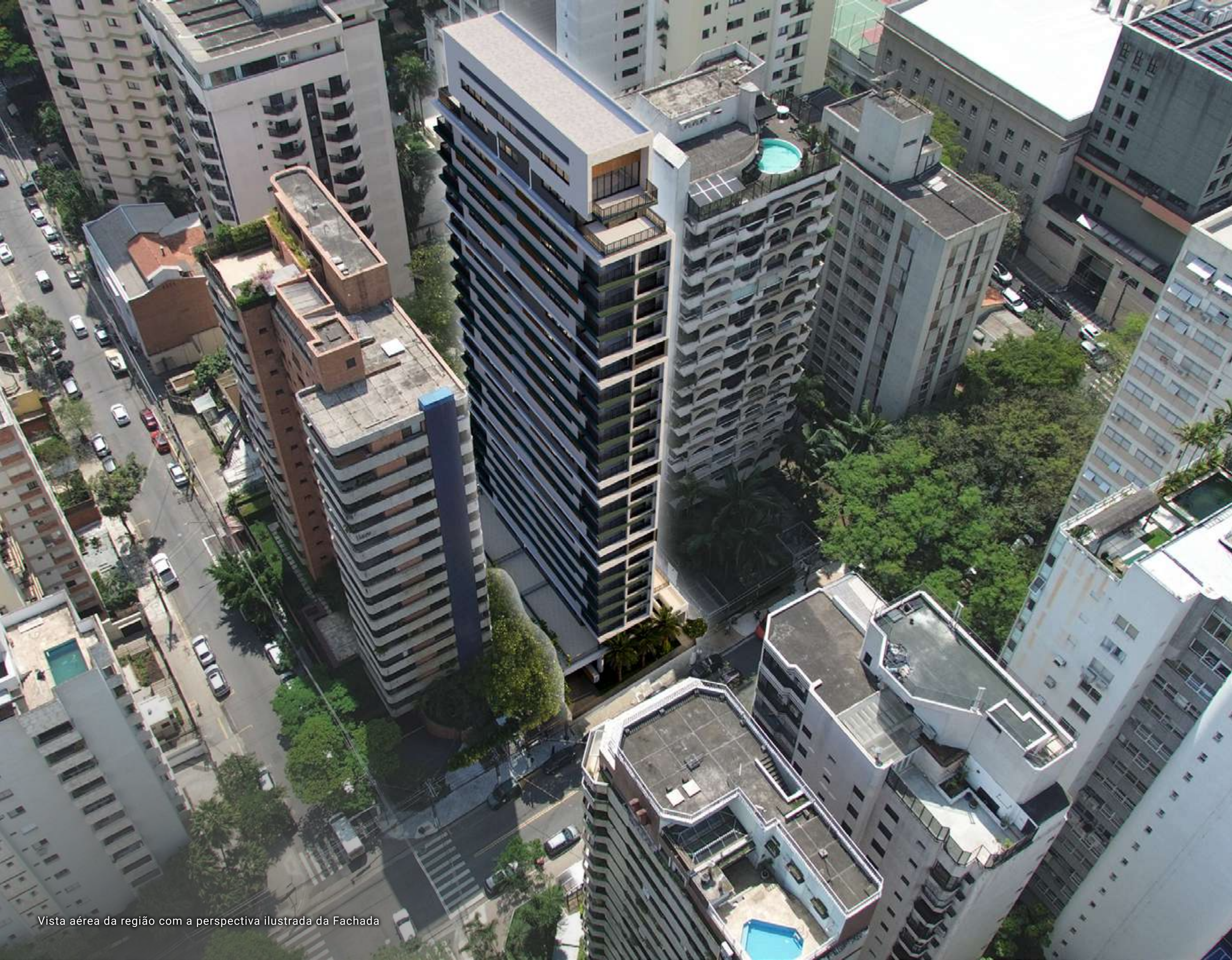
Vista aérea da região com a perspectiva ilustrada da Fachada