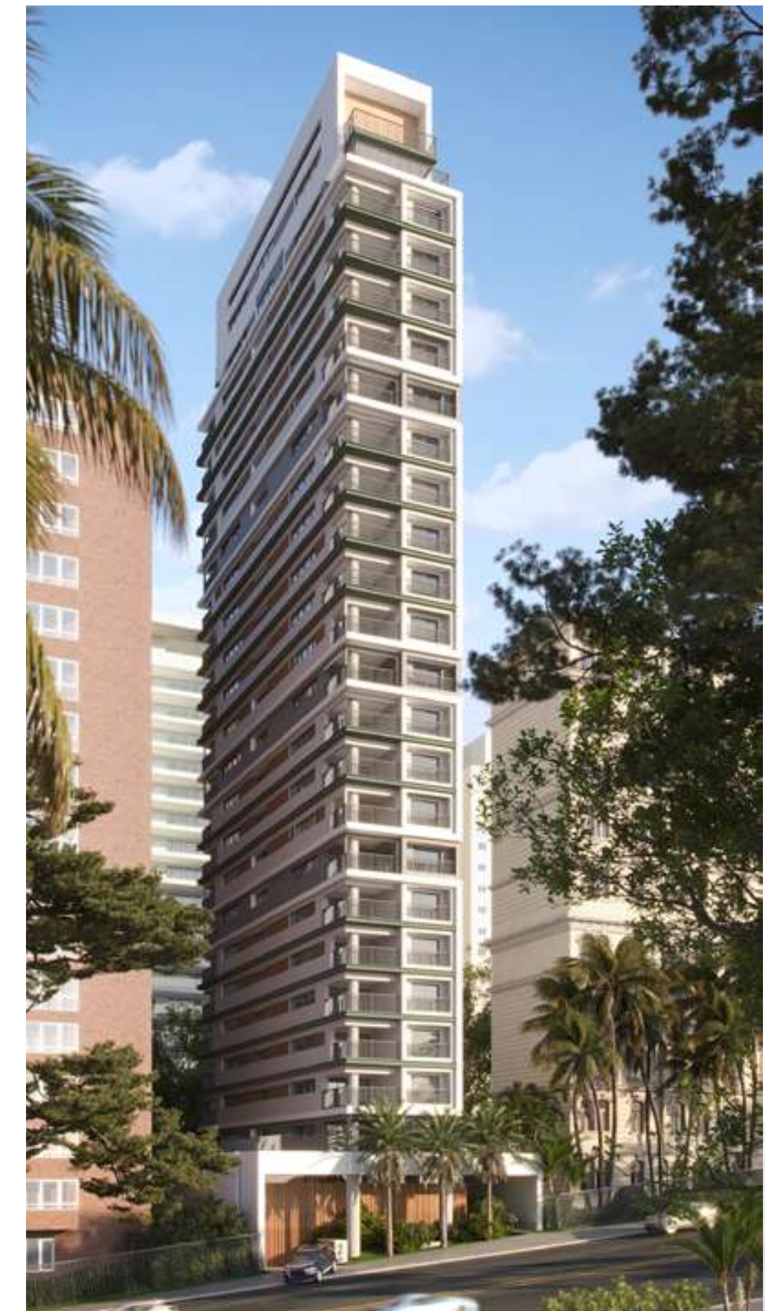
Perspectiva ilustrada da Fachada