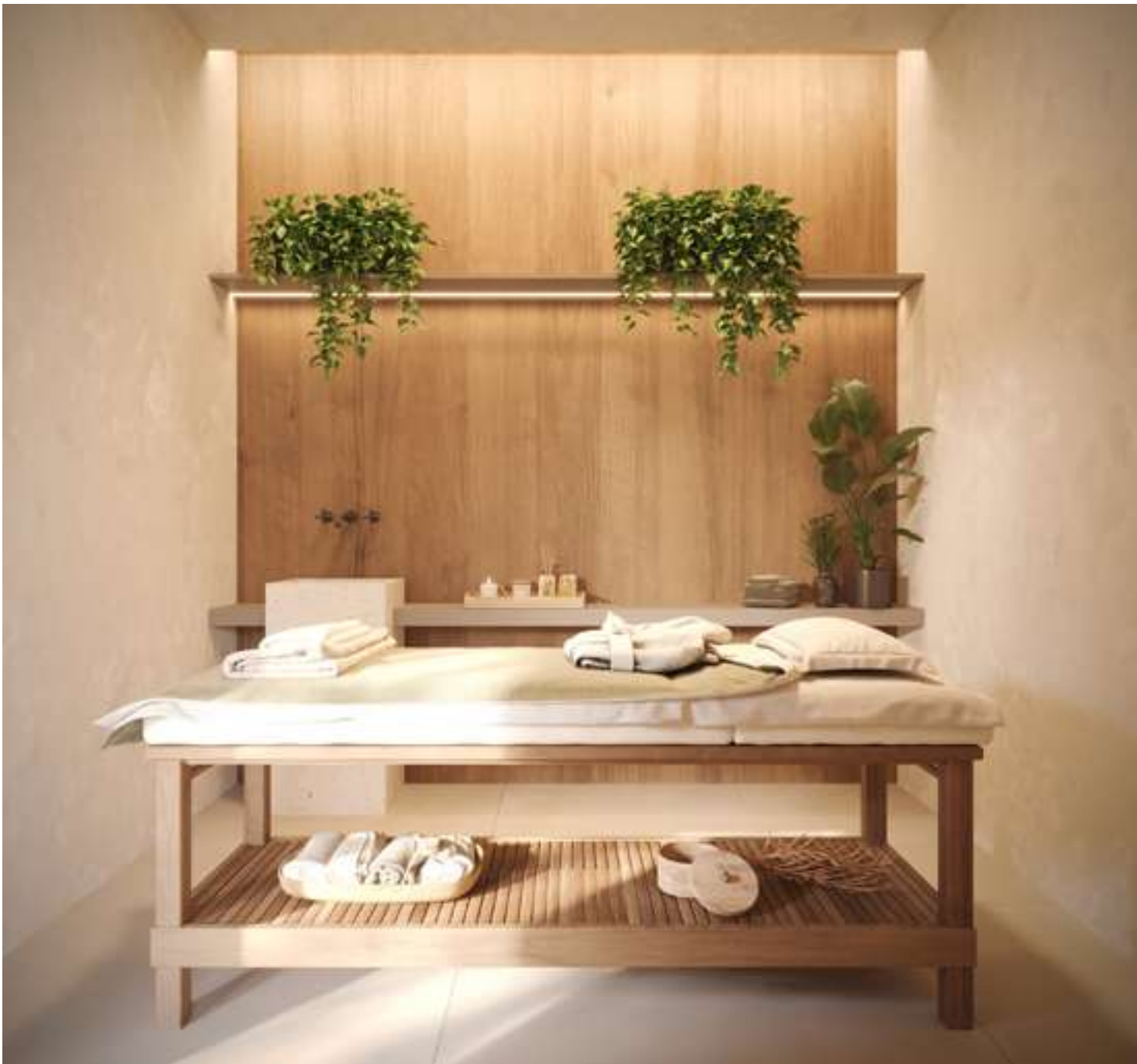
Perspectiva ilustrada da Massagem