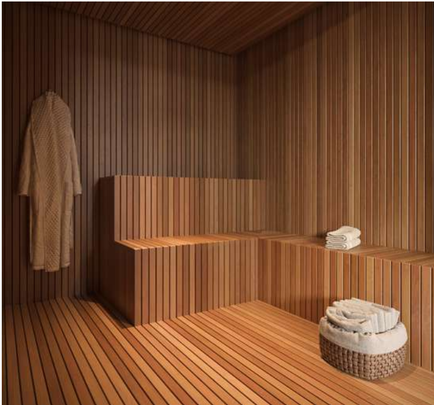
Perspectiva ilustrada da Sauna