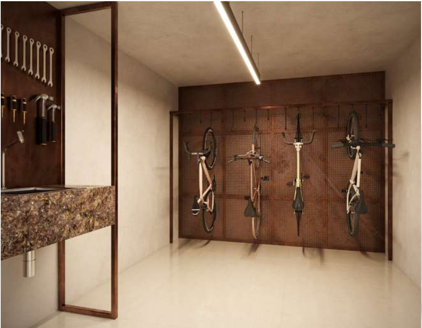
Perspectiva ilustrada do Bicicletário