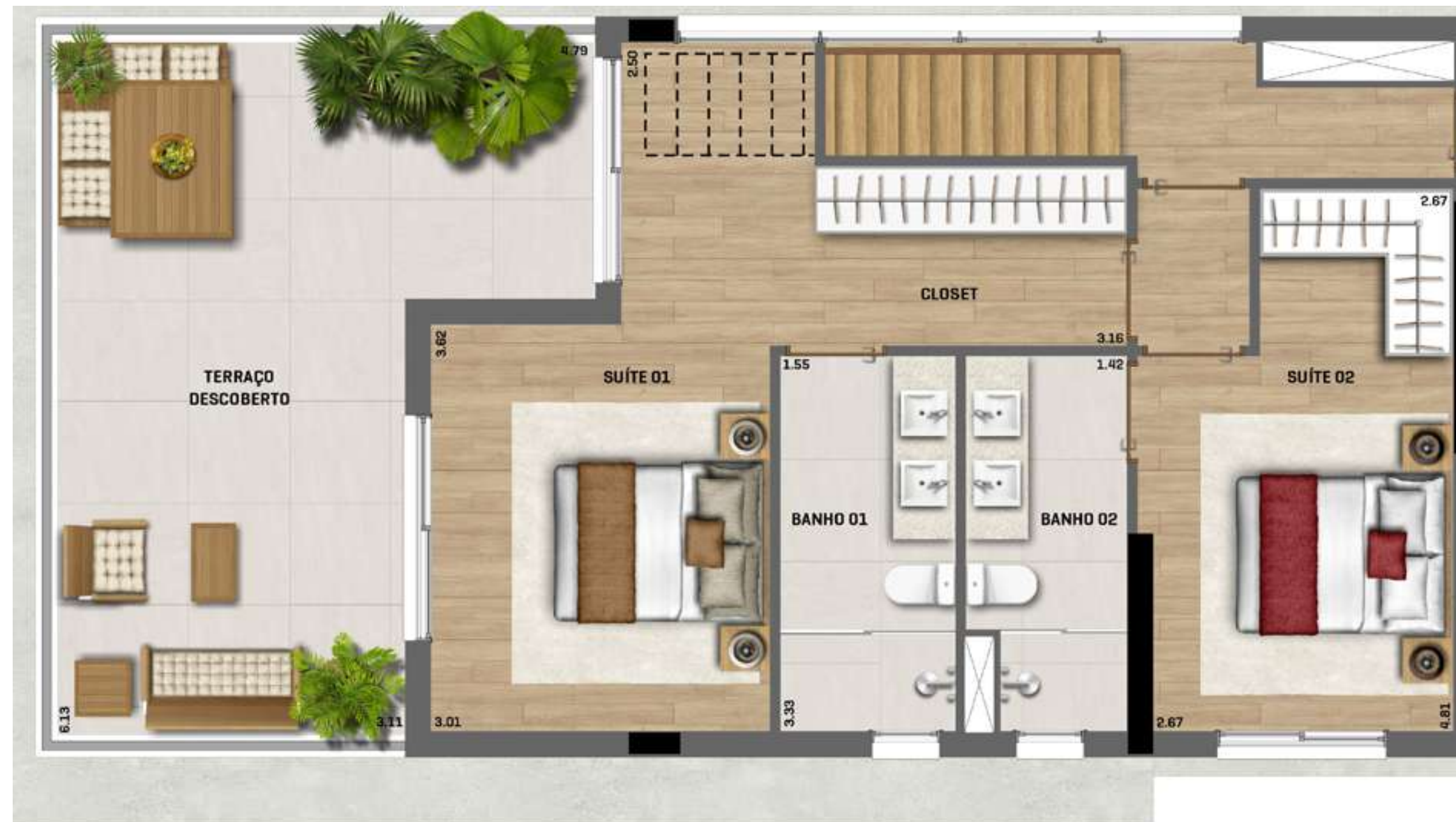
Apartamento Duplex Inferior Final 01 ÁREA TOTAL = 159m 2