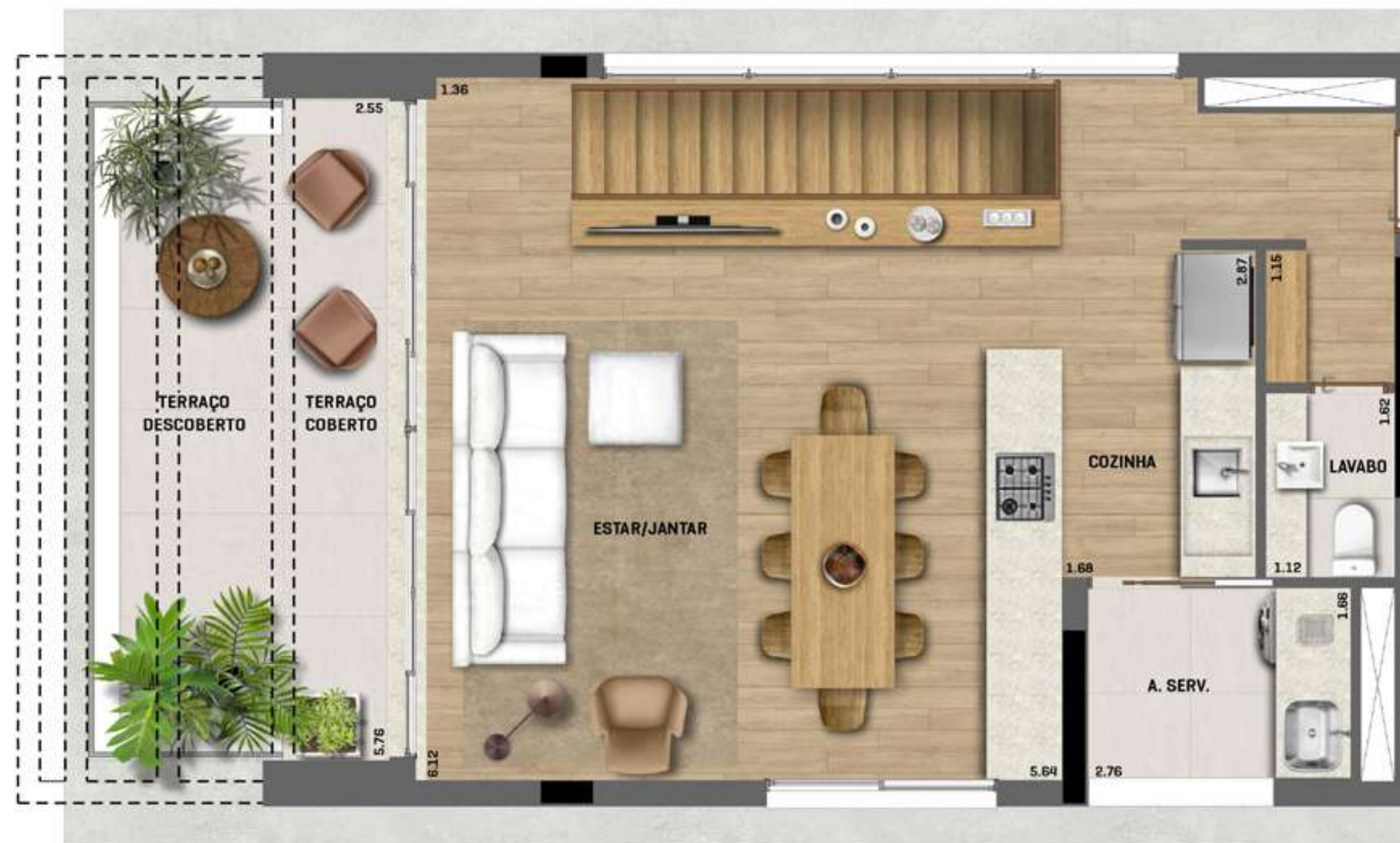
Apartamento Duplex Superior Final 01 ÁREA TOTAL = 159m 2