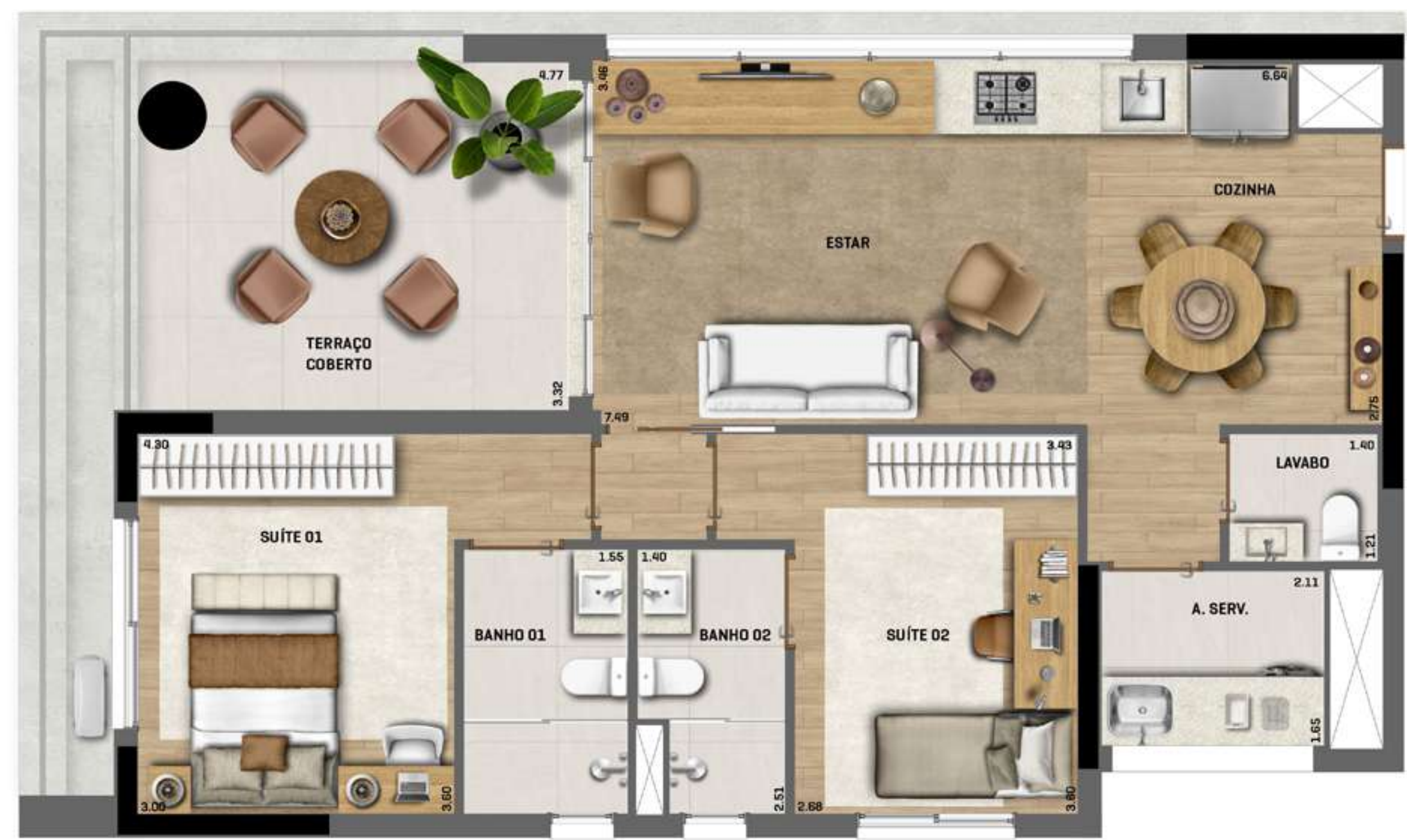
Apartamento-Tipo Final 01 ÁREA TOTAL = 93m 2